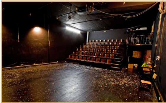
Teatro de Bolso