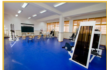
Sala de Fitness